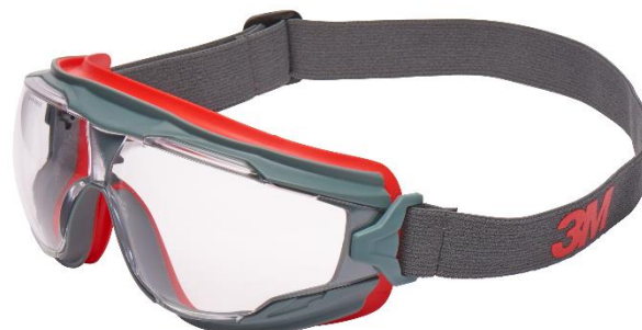
3M™ GoggleGear™ 500