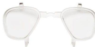
3M™ GoggleGear™ Inserto de prescripción