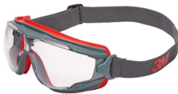
3M™ GoggleGear™ 501SGAF Scotchgard - Claro