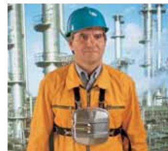
SSR 30/100 B